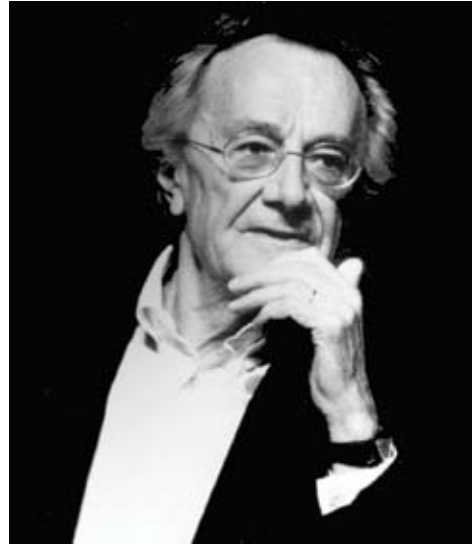
جان فرانسوا ليوتار

فمن الناحية المنهجية فقد رفضت ما بعد الحداثة إمكانية اختزال دراسة العلوم الإنسانية أو محاكاتها للعلوم الطبيعية، الأمر الذي دفعها إلى تجنب الاتجاهات السلوكية والطبيعية. وعلى عكس الفيزياء أو الكيمياء أو الأحياء، فإن العلوم الإنسانية ينبغي أن تفهم الخبرة ووجهة نظر الشخص موضوع الدراسة، إنها لا تهتم بمجرد الحقائق، ولكن بمعنى هذه الحقائق وتفسيرها للموضوعات الإنسانية.